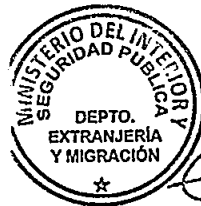
KATIUSKA LORCA SILVA Sección Visas

RSD/PVS/VGL/kca [308]18/05/2016 Distribución: 1.- Policía Internacional 2.- Archivo