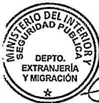
KATIUSKA LORCA SILVA Sección Visas

RSD/PVS/VGL/dzc [322]13/05/2016 Distribución: 1.- Policía Internacional 2.- Archivo