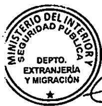
KATIUSKA LORCA SILVA Sección Visas

RSD/PVS/VGL/MBS [721]15/04/2016 Distribución: 1.- Policía Internacional 2.- Archivo