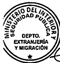
KATIUSKA LORCA SILVA Sección Visas

RSD/PVS/VGL/MAB [322]05/04/2016 Distribución: 1.- Policía Internacional 2.- Archivo