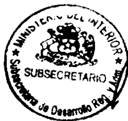
RICARDO CIFUENTES LILLO SUBSECRETARIO DE DESARROLLO REGIONAL Y ADMINISTRATIVO