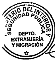
KATIUSKA LORCA SILVA Sección Visas

Distribución: 1.- Policía Internacional 2.- Archivo