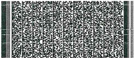
Timbre electrónico SRCEI

Verifique documento en www.registrocivil.gob.cl o a nuestro Call Center 600 370 2000, para teléfonos fijos y celulares. La próxima vez, obtén este certificado en www.registrocivil.gob.cl .