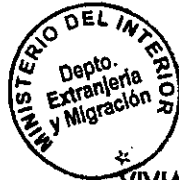
VIVIANA GONZALEZ LOPEZ SECCION VISAS

CDH/PVS/TA [323] 01/03/2011 Distribución: 1.- Policía Internacional 2.- Archivo