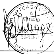
FIRMA Y TIMBRE DEL MINISTRO DE FE