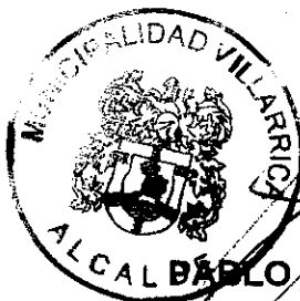
PABLO ASTETE MERMOUD ALCALDE MUNICIPALIDAD DE VILLARRICA