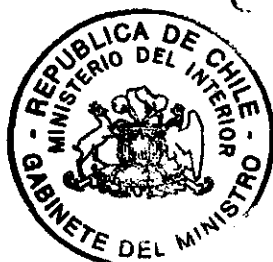
PATRICIO ROSENDE LYNCH MINISTRO DEL INTERIOR SUBROGANTE