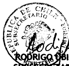
RODRIGO UBILLA MACKENNEY SUBSECRETARIO DEL INTERIOR MINISTERIO DEL INTERIOR