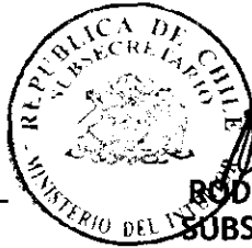
RODRIGO UBILLA MACKENNEY SUBSECRETARIO DEL INTERIOR MINISTERIO DEL INTERIOR