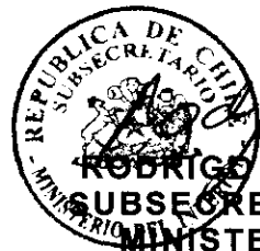
RODRIGO UBILLA MACKENNEY SUBSECRETARIO DEL INTERIOR MINISTERIO DEL INTERIOR