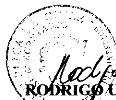
RODRIGO UBILLA MACKENNEY SUBSECRETARIO DEL INTERIOR MINISTERIO DEL INTERIOR