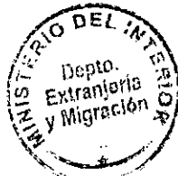
PATRICIA VASQUEZ SEPULVEDA SECCIÓN VISAS

CDH/PVS/kl [308]17/11/2010 Distribución: 1.- Policía Internacional 2.- Archivo