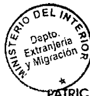
PATRICIA VASQUEZ SEPULVEDA SECCION VISAS

CDH/PVS/MAB [323] 12/10/2010 Distribución: 1.- Policía Internacional 2.- Archivo