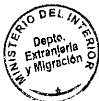
PATRICIA VASQUEZ SEPULVEDA SECCION VISAS

CDH/PVS/arp [721]03/09/2010 Distribución: 1.- Policía Internacional 2.- Archivo