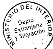
PATRICIA VASQUEZ SEPULVEDA SECCION VISAS

CDH/PVS/MAB {323} 11/08/2010 Distribución: 1.- Policía Internacional 2.- Archivo