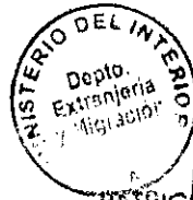
PATRICIA VASQUEZ SEPULVEDA SECCIÓN VISAS

CDH/PVS/arp [308]20/07/2010 Distribución: 1.- Policía Internacional 2.- Archivo