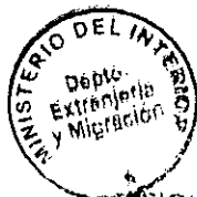
PATRICIA VASQUEZ SEPULVEDA SECCION VISAS

CDH/PVS/arp [308]15/07/2010 Distribución: 1.- Policía Internacional 2.- Archivo