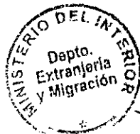
PATRICIA VASQUEZ SEPULVEDA SECCION VISAS

CDH/PVS/TA [323] 29/06/2010 Distribución: 1.- Policía Internacional 2.- Archivo