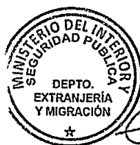
KATIUSKA LORCA SILVA Sección Visas

1.- Policía de Investigaciones de Chile 2.- Archivo DEM