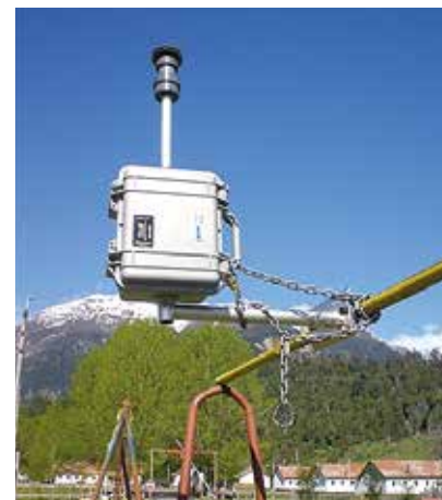
Equipos de Medición de la Calidad del Aire.

Por último esta línea de acción presenta un proyecto para el control reproductivo y desparasitación de mascotas. Esta desparasitación contempla un tratamiento durante un año, el cual se espera que genere un impacto en la disminución del parásito en la población canina y con ello prevenir la hidatidosis. Además se han realizado diálogos ciudadanos para elaborar un plan de trabajo específico para Chaitén, asociado al Plan Nacional de Tenencia Responsable de Mascotas.