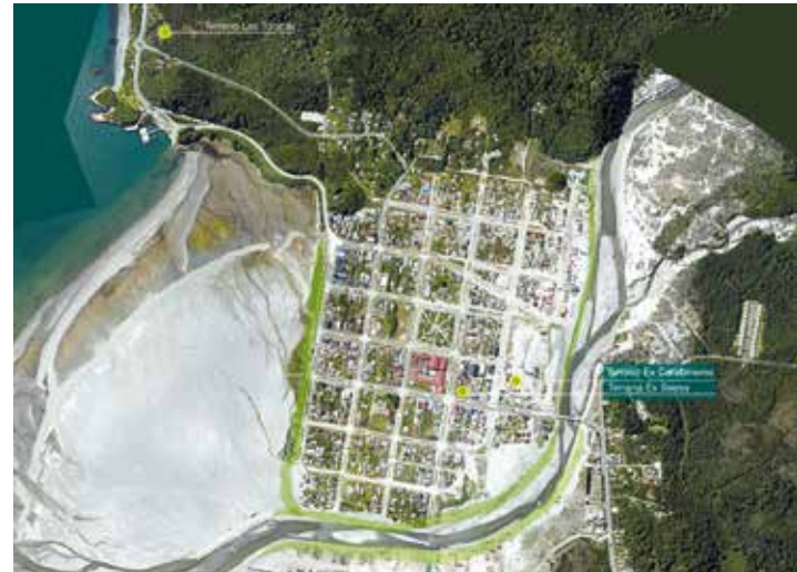
Emplazamiento de los futuros proyectos habitacionales.

Forman parte de esta línea de acción los proyectos corresponden a la Infraestructura y equipamiento de carácter público, incluidos programas y subsidios, que dan respuesta a las necesidades en lo que respecta a las condiciones urbanas y de conectividad. En primer lugar esta línea acción contempla la construcción de 240 viviendas destinadas a satisfacer la demanda existente de familias hábiles para recibir una solución habitacional. El diseño de estas viviendas que inician sus obras en el primer semestre del año 2015, se trabaja de un modo participativo, ya se han realizado algunas reuniones en materias de vivienda, por lo que se espera llegar a 3 tipologías de diseño desarrollados