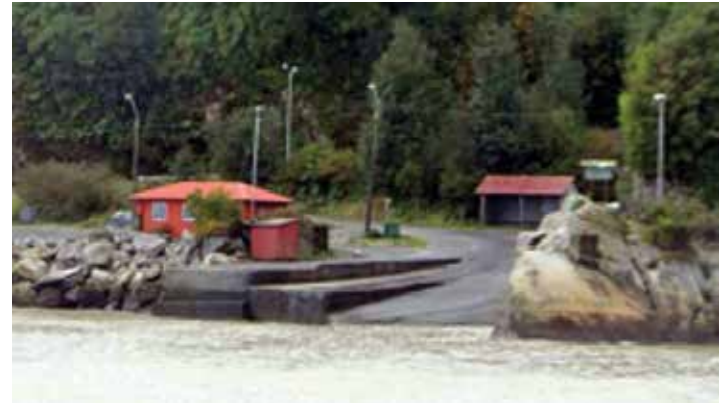
Construcción atraque alternativo y conservación Rampa de Transbordadores de Chaitén y Explanada Pesca Artesanal.

Por último esta línea de acción contempla proyectos de equipamiento urbano dañado o perdido tras la erupción del volcán, que devuelve a la comuna de Chaitén las condiciones para ejercer en propiedad su rol de Capital de la Provincia de Palena. La reconstrucción de los edificios de la Gobernación provincial y del edificio Consistorial de la Municipalidad de Chaitén, como también la nueva obra de Plaza de Armas, contribuyen a la rehabilitación del centro cívico y administrativo de la comuna de Chaitén.